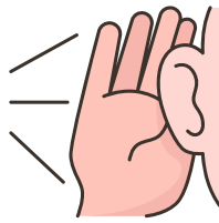
Sens de l'écoute et du service