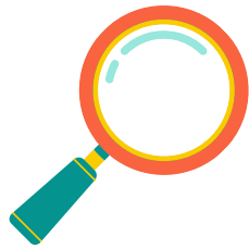
Esprit d'analyse et de synthèse